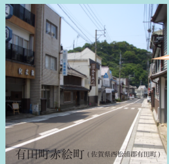
有田町赤絵町 (佐賀県西松浦郡有田町)