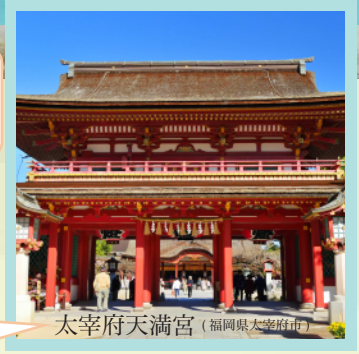
太宰府天満宮 (福岡県太宰府市)