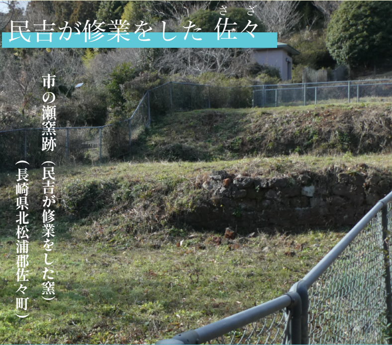
民吉が修業をした佐々