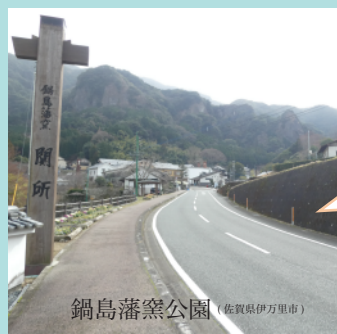
鍋島藩窯公園 (佐賀県伊万里市)

◇旅行代金 お一人様 7万円 (税込) ◇定員 15名 (最少催行人数 8名) ◇宿泊先 東横 INN 佐世保駅前 (長崎県佐世保市三浦町 1-4) 洋室シングル (バス・トイレ付)